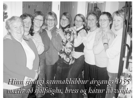
Hinn síunggi samfélagsklubur árgangs 1955 metur að sjálfsögðu, bress og kátur að vanda