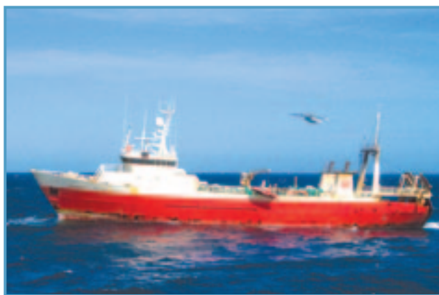
Mánaberg ÓF 42 – skip Þormóðs ramma – Sæbergs - á miðunum.

Við skoðun á rekstri Ólafsfjarðarbæjar og Siglufjarðarkaupstaðar annars vegar og sameinaðs sveitarfélags hins vegar kemur fram að unnt er að ná fram hagræðingu í rekstri sameinaðs sveitarfélags, frá því sem nú er, og bættri nýtingu fjármuna. Þessari hagræðingu, sem fyrst og fremst er horft til að skili sér í aukinni þjónustu við íbúana, er að hluta hægt að ná fram strax, en hún skilar sér ekki að fullu fyrr en í kjölfar opunar Héðinsfjarðarganga.