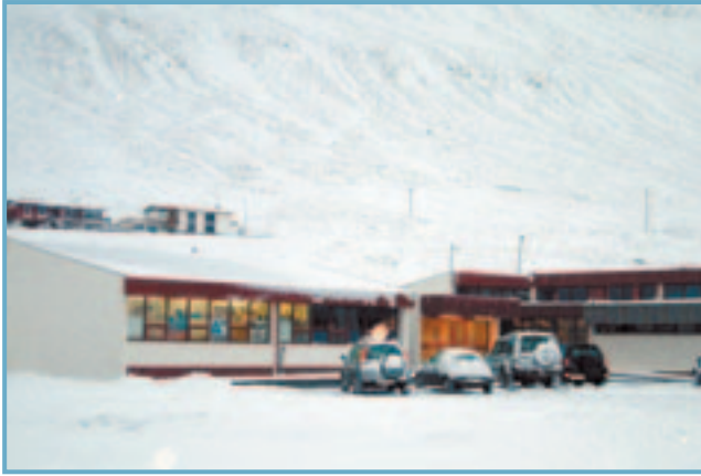
Gagnfræðaskólahúsið í Ólafsfirði.