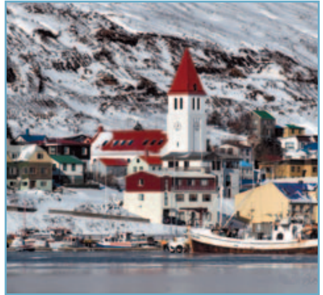
Í hjarta Siglufjarðarbæjar.