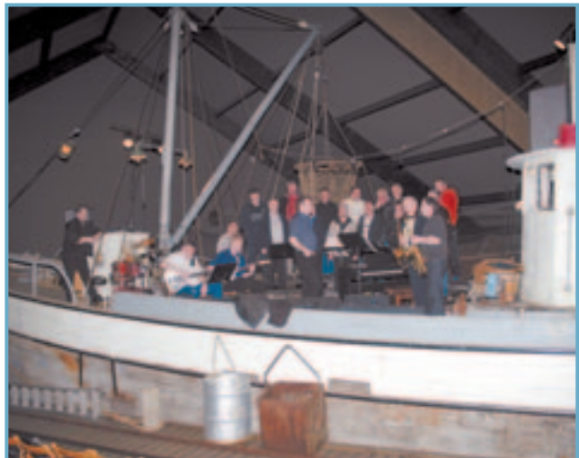
Tónaflóð í Bátahúsi Síldarminjasafnsins á Siglufirði.