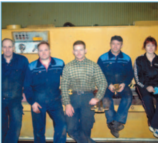
Starfsmenn Vélsmiðju Ólafsfjarðar í stuttri pásu.

Siglufirði, að því gefnu að forsvarsmenn sameinaðs sveitarfélags velji að halda úti slíkri starfsemi á annað borð.