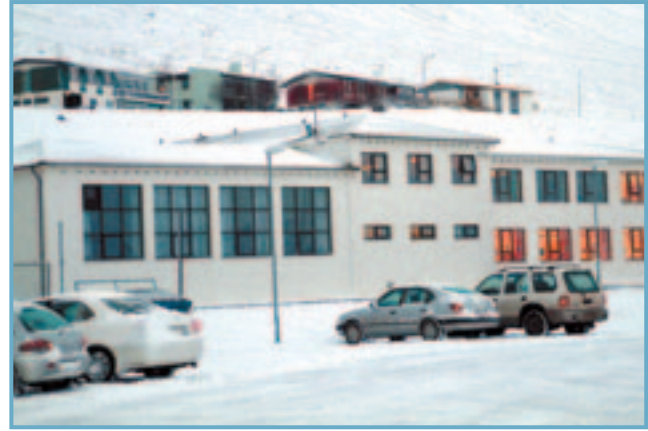
Gamla barnaskólahúsið í Ólafsfirði.

Ekki eru lagðar til miklar breytingar í rekstri og stjórnun leikskólanna Leikhóla í Ólafsfirði og Leikskála á Siglufirði. Börn verða að jafnaði í leikskóla þar sem þau eru búsett, en hins vegar opnast sá möguleiki að þetta geti snúist við í þeim tilvikum þar sem foreldrar búa á öðrum staðnum en vinna á hinum.