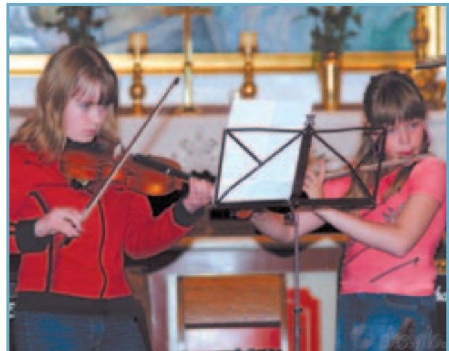
Ungt og efnilegt tónlistarfólk á Siglufirði.

Við það er miðað að skólamálskrifstofa verði starfandi á svæðinu sem hafi með höndum yfirstjórn skólamála í umboði fræðslunefndar og veiti skólunum ráðgjöf og sérfræðiþjónustu og/eða verði milligönguaðili um að veita slíka þjónustu.