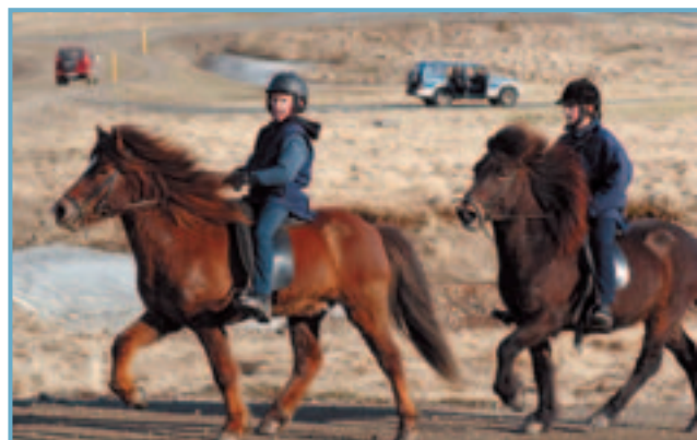
Ungir hestamenn á Siglufirði.

Frambærileg aðstaða til íþrótt- og útivistar er til staðar á báðum stöðum, en hún er þó vissulega mismunandi góð, eins og gengur. Sem dæmi um mögulega hagræðingu í þessum málaflokki má nefna að lagt er til að í Ólafsfirði verði helsti keppnisvöllur sameinaðs sveitarfélags í knattspyrnu og á Siglufirði verði aðal skíðasvæði sveitarfélagsins í alpagreinum. Þá liggur fyrir, sem dæmi, að hin glæsilega íþróttamiðstöð í Ólafsfirði gæti nýst meiri mannfjölda en nú býr í Ólafsfirði.