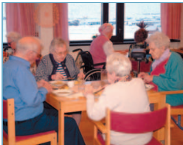
Heimilisfólk á Hornbrekku snæðir hádegismat.