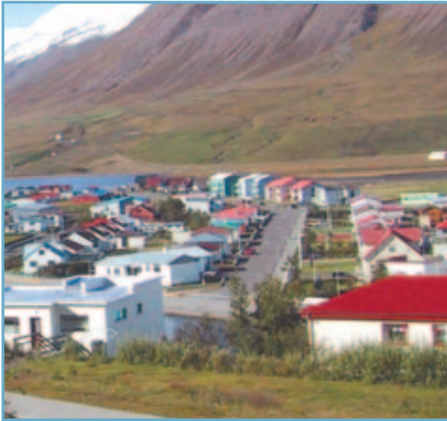
Horft yfir hluta Ólafsfjarðarbæjar og Ólafsfjarðarvatns.