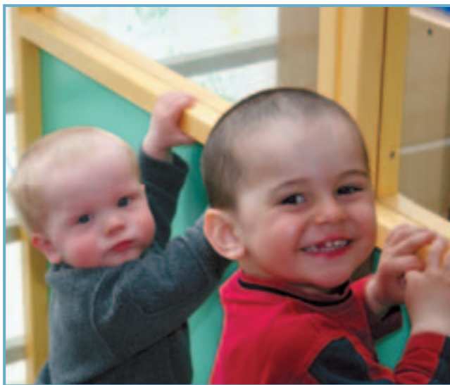
Leikskólakrakkar á Siglufirði.

Fjárhagur sameinaðs sveitarfélags verður til lengri tíma litill góður. Betri möguleikar eru til að ráðast í ýmsar framkvæmdir og trúir ég því að með sameiningunni losni úr viðjum mikill kraftur, þegar íbúunum gefst kostur á að brjótask