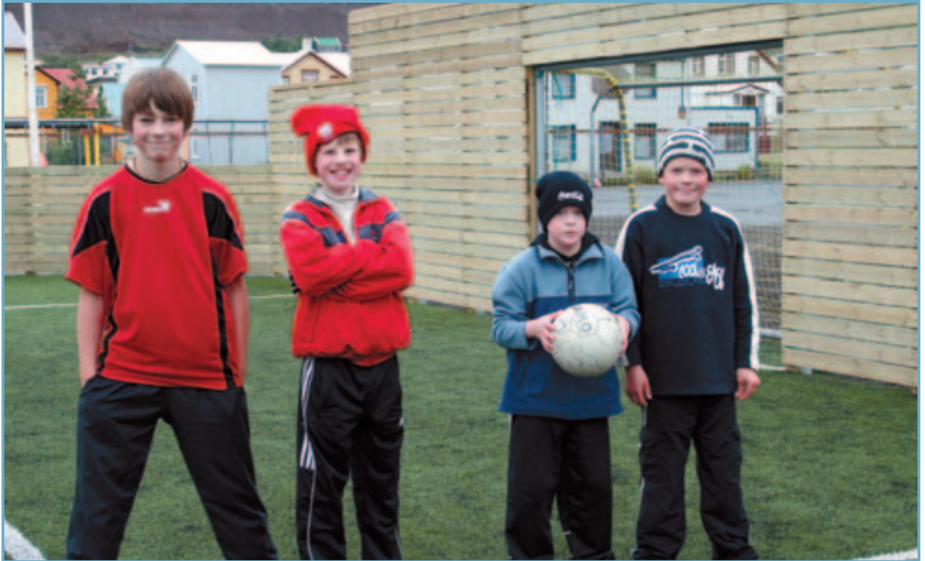
Upprennandi knattspymukappar á Siglufirði.