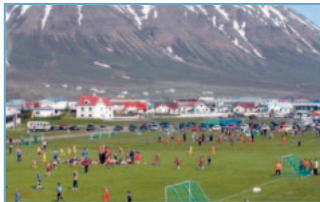
Íðandi mannlíf á Nikulásarmóti í knattspyrnu í Ólafsfirði.