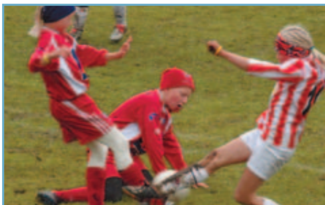
Hart barist á Þejumóti KS.

Hefð er fyrir mjög öflugu íþrótt- og æskulýðsstarfi í báðum bæjarfélögum og engin ástæða er til að ætla annað en að svo verði áfram í nýju sameinuðu sveitarfélagi. Með samgöngubótum er fyrirsjáanlegt að samstarf í þessum málaflokki muni aukast enn frekar, en nú þegar hafa meistaraflokkar íþróttafélaganna KS og Leifturs í knattspyrnu ákveðið að stilla saman strengi og tefla fram sameiginlegu liði á komandi keppnistímabili.