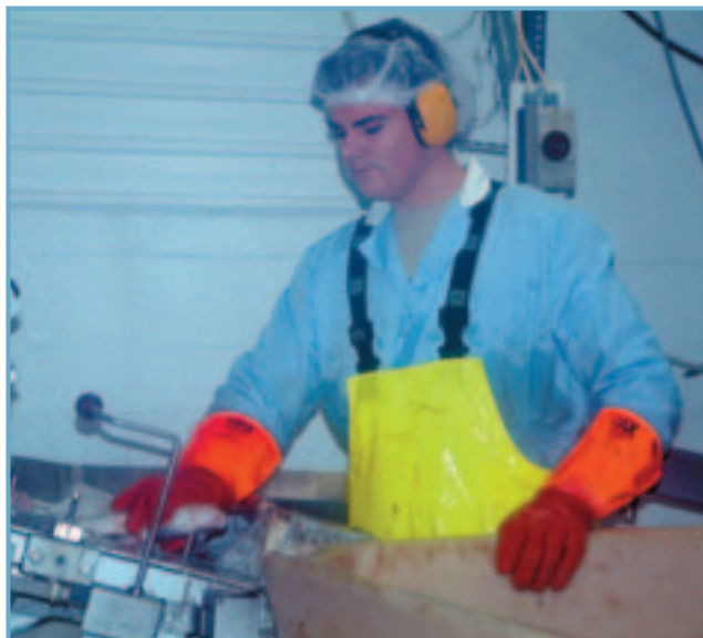
Tekið til hendinni í fiskvinnslu Stíganda í Ólafsfirði.

Með tilkomu Héðinsfjarðarganga munu samskipti innan hins nýja sameinaða sveitarfélags stórukast. Gerð er tillaga um að eftir að göngin verða tekin í gagnið komi sameiginlegt sveitarfélag á fót almenningsgöngum, sem nýtist m.a. skólasókn í framhaldsskóla, til atvinnusóknar milli staðanna, tórstunda o.s.frv.