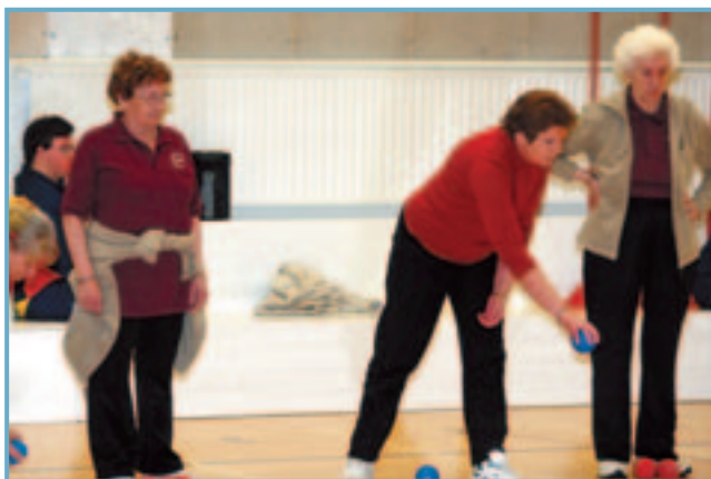
Æfing í bocca á Siglufirði.

Gerð er tillaga um að barnaverndarnefnd verði áfram starfandi fyrir sama svæði og nú, þ.e. Dalvíkurbyggð og sameinað sveitarfélag Ólafsfjarðarbæjar og Siglufjarðarkaupstaðar.