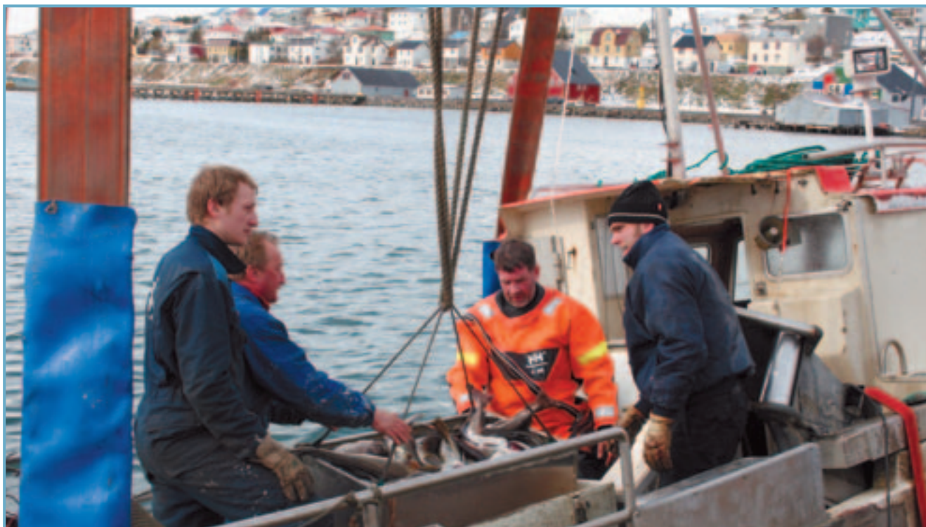
Löndun á Sigló.

Áfram er gert ráð fyrir rekstri áhaldahúsa í Ólafsfirði og á