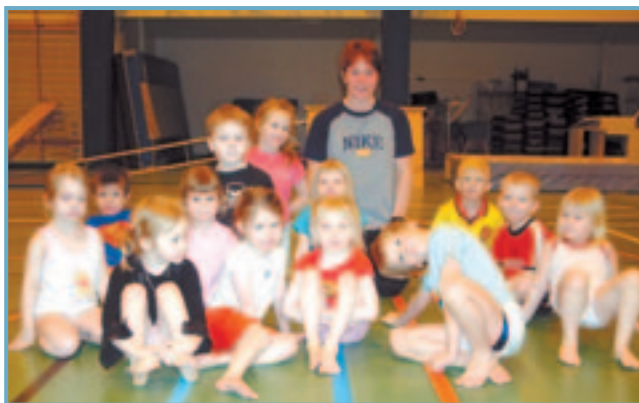
Leikskólakrakkar í Ólafsfirði með kennaranum sínum að loknum vel heppnuðum leikfimitíma í íþróttamiðstöðinni.