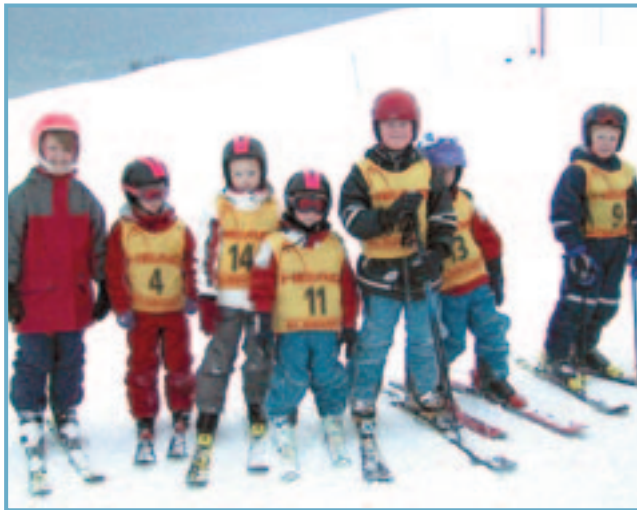
Skiðakrakkar í Ólafsfirði.