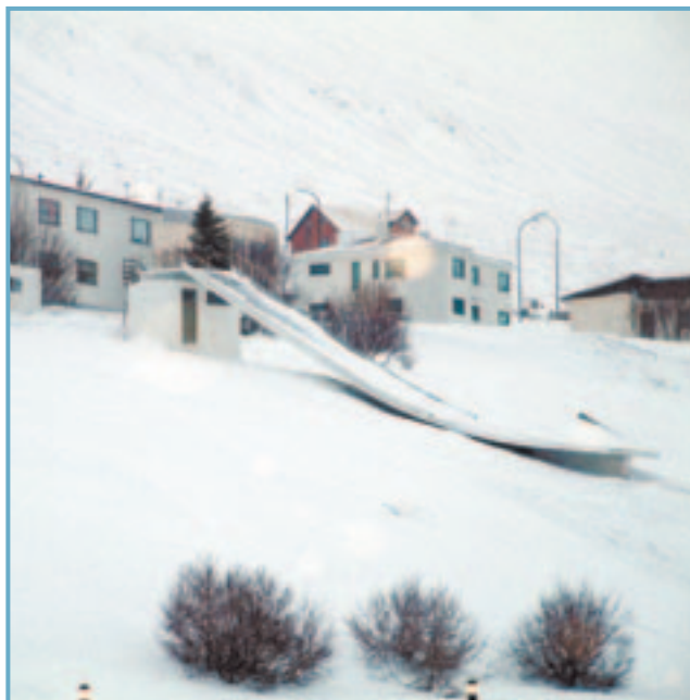
Eitt helsta tákni Ólafsfjarðar – stökkpallurinn í hjarta bæjarins.

Í Ólafsfirði, í núverandi húsnæði bæjarskrifstofu, verði: Framkvæmdastjóri fjölskyldusviðs ásamt tveimur starfsmönnum, ritari og launafulltrúi. Samtals 5 stöðugildi.