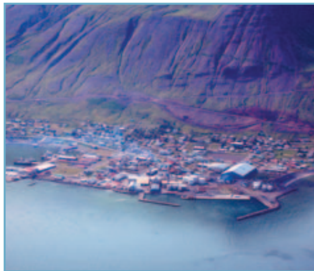
Siglufjörður úr lofti

Þessari framtíðarsýn hafa sem betur fer ráðamenn þjóðar-