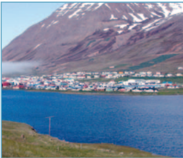
Horft til Ólafsfjarðar.